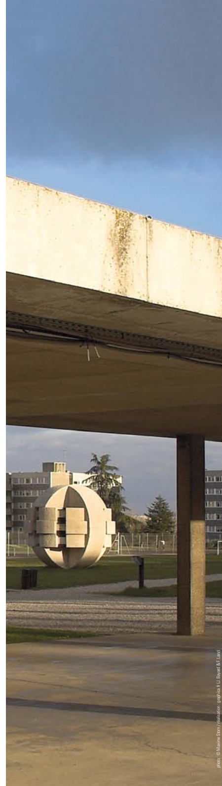
Réalisation graphique: K.U. Bayard & Lancelotti